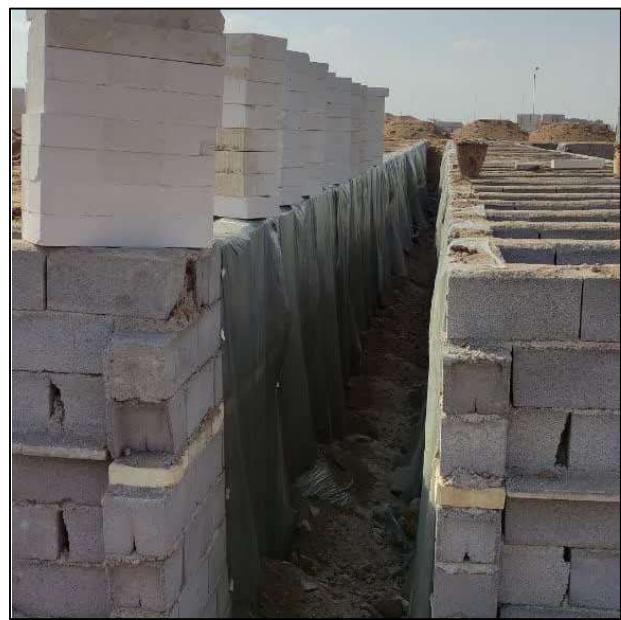
شکل 2- پوشش نایلونی در مجاورت دیواره خارجی بدنه قبور