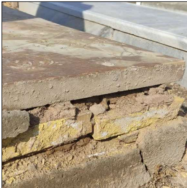
شکل 1- تاثیر شوری خاک بر سازه های عمرانی

یکی دیگر از اقدامات سازمان در این راستا، قراردادن یک عایق با پوشش نایلونی در مجاورت دیواره خارجی بدنه قبور جهت مسدود کردن حفره‌ها بوده است که این راهکار نیز به دلیل آسیب وارده بر آنها در زمان اجرا بصورت دائم قابل استفاده نمی‌باشد.